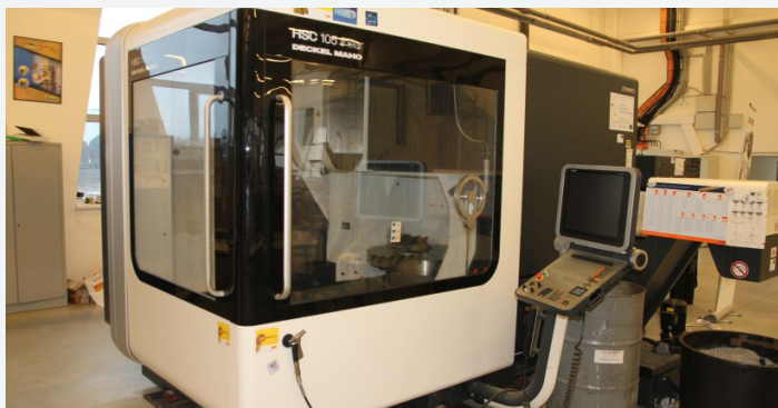
5-osové HSC frézovacie centrum DMG HSC 105 Linear