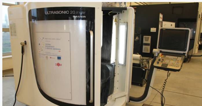
5-osový obrábací stroj DMG Ultrasonic 20