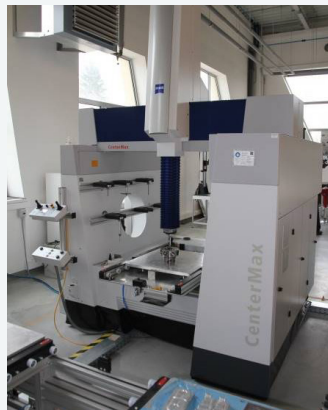
ZEISS CenterMax 3D coordinate measuring machine