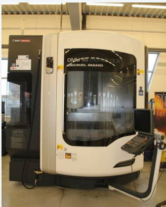
DMG DMU monoBLOCK 85 5-axis milling centre