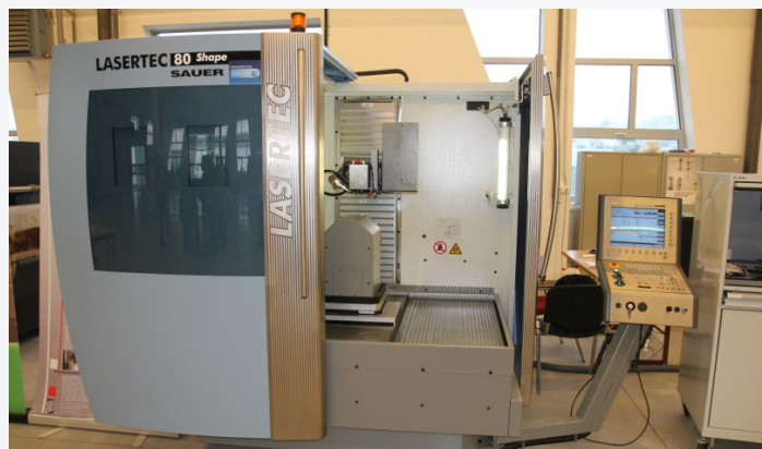
5-osový laserový obrábací stroj SAUER Lasertec 80 Shape