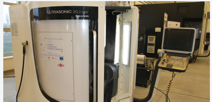
DMG Ultrasonic 20 5-axis machine tool with ultrasonic assistance