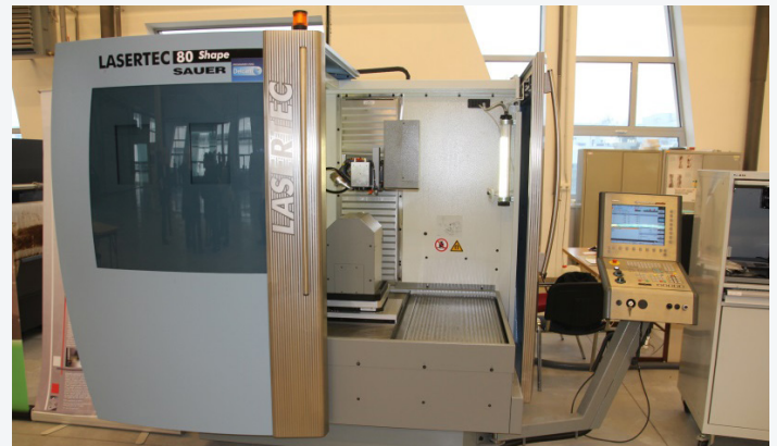
SAUER Lasertec 80 Shape 5-axis laser machine tool