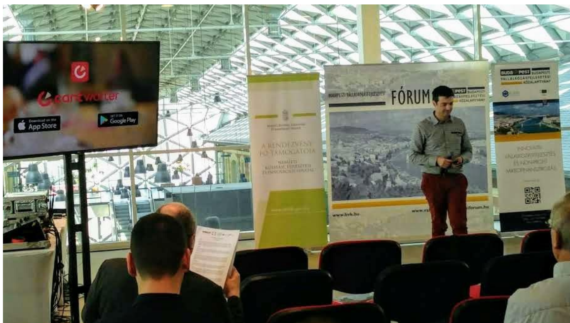
Prezentácia startupu Cantwaiter na Budapest Startup Expo 4. apríla 2019

sa prevádzkové procesy, čím zákazník ušetrí čas a podnik dosiahne rast tržieb a úsporu pracovníkov.