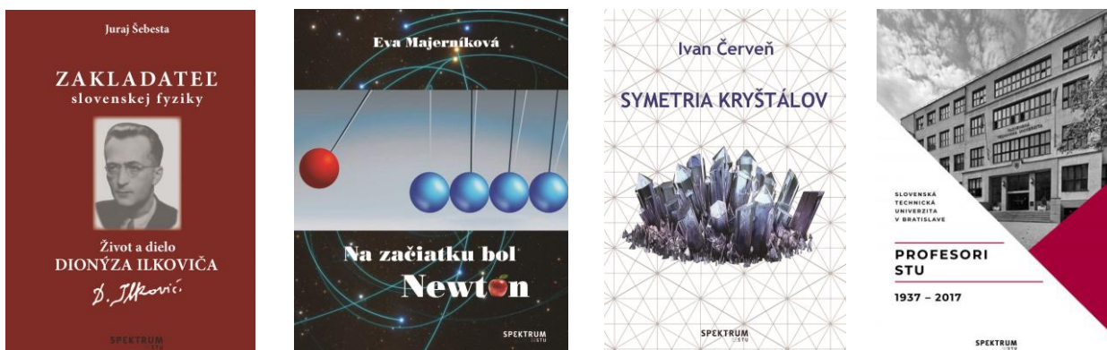
Tab. 12. Vybrané tituly v 1. polroku 2019