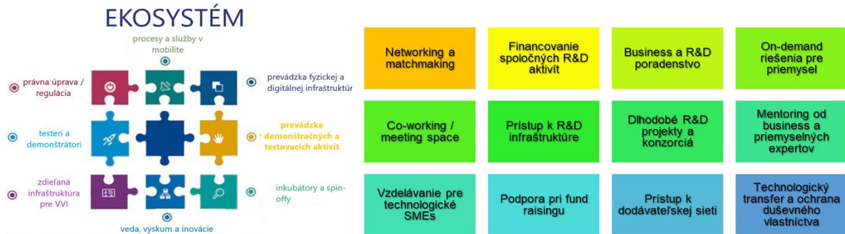
Obrázok 2 Postavenie združenia v rámci ekosystému a príklady aktivít, na ktorých sa v najbližšom čase má podieľať

Úloha združenia v rámci ekosystému a príklady aktivít sú naznačená na nasledujúco obrázku.