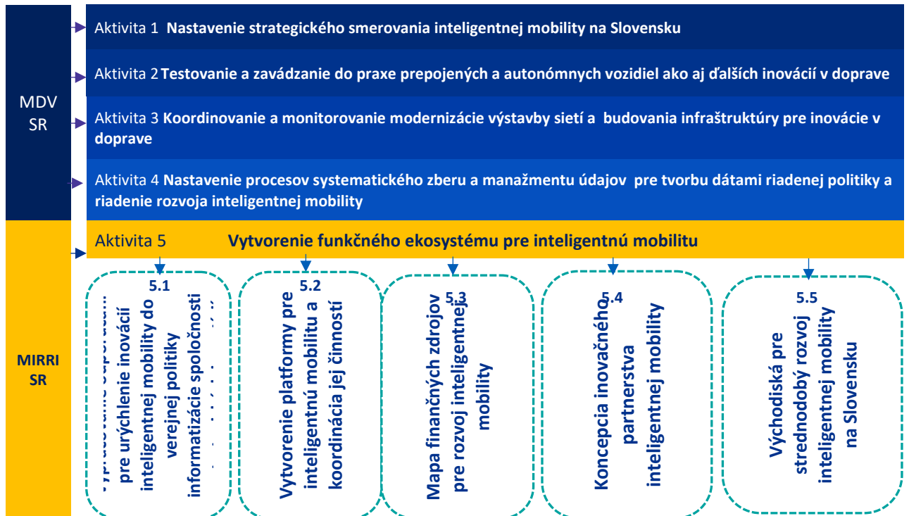
Obrázok 3 Prehľad hlavných aktivít národného projektu a zameranie aktivity 5 v gescii MIRRI

Mapa hlavných výstupov z hlavných aktivít je na obr. 4: