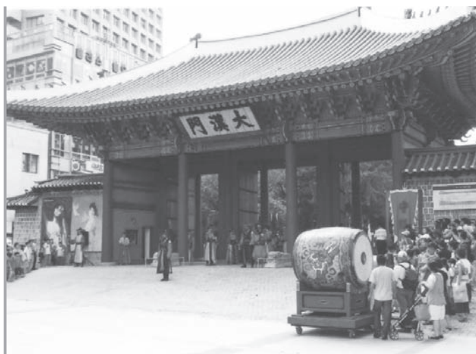
Soul má čo ponúknuť milovníkom starého aj moderného umenia. Na fotografii je výmena stráží pred palácom Doeksugung.

štýle, bolo vidieť na každom kroku. Hneď po príchode sme absolvovali niekoľko uvítacích stretnutí. Stoly sa doslova prehýbali pod miestnymi špecialitami, chobotnice, kraby, kórejské suši, amoniakové ryby či kaviár a, samozrejme, ryža. A na naše prekvapenie nechýbal ani národný alkohol soджу, ktorému Kórejčania nevedia odolať.