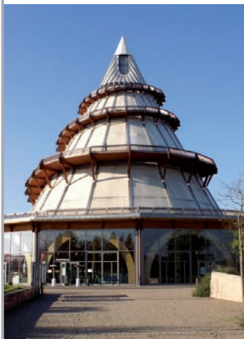
▲ Veža Miléna v ktorej sa konal kongres