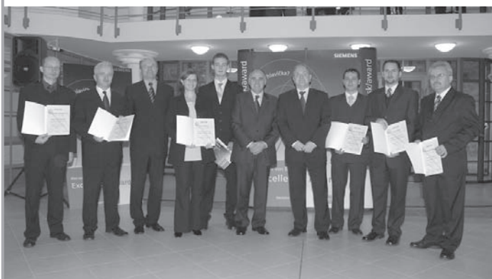
Vítazi súťaže Werner von Siemens Award.