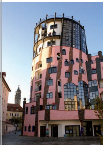
▲ Nielen Viedeň, najnovšie aj Magdeburg má svoj Hunderdtwasserer dom. ►