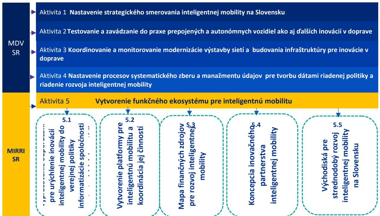
Obrázok 3 Prehľad hlavných aktivít národného projektu a zameranie aktivity 5 v gescii MIRRI

Mapa hlavných výstupov z hlavných aktivít je na obr. 4: