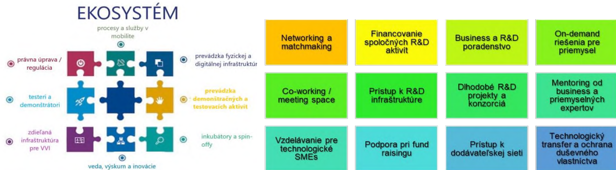
Obrázok 2 Postavenie združenia v rámci ekosystému a príklady aktivít, na ktorých sa v najbližšom čase má podieľať

Úloha združenia v rámci ekosystému a príklady aktivít sú naznačená na nasledujúco obrázku.