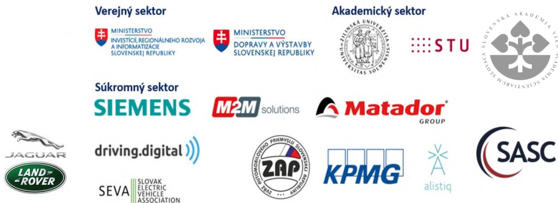
Obrázok 1 Zakladajúce a prístupujúce subjekty združenia Inteligentná mobilita Slovenska

O platformu javia záujem aj ďalšie subjekty. Potenciálne podľa výsledkov pasportizácie je aktívnych niekoľko stoviek subjektov na domácom trhu.