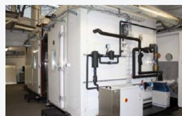
Veľká klimatická komora pre synergický výskum šírenia tepla, difúzie vodnej pary a infiltrácie vzduchu / Big climatic chamber for synergic research of heat transfer, diffusion of water vapour and air infiltration