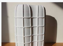
Pohľad na budovu vytlačenú v mierke 1:300 pomocou 3D tlačiarne / The view of 3D printed building in 1:300 scale