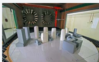
Pohľad na model s testovaním vzájomnej interferencie elipsoidných výškových budov umiestnených v aerodynamickom tuneli / The view of a model tested for mutual interference of elliptical high-rise buildings located in the wind tunnel