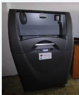
Zariadenie 3D tlačiarne s oprašovačom / 3D printer with duster