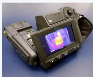
Infračervená kamera Flir T620 / The infrared camera Flir T620