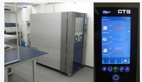
Pohľad na komoru pre výskum spoľahlivosti striech / The view of the chamber for research of reliability of roofs