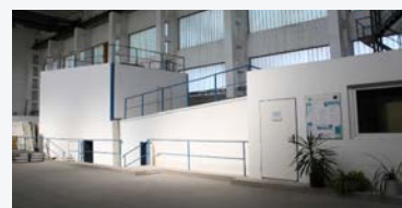
Pohľad na akustické komory Stavebnej fakulty v Centrálnom laboratóriu na Trnávke / The view of acoustical chambers of Faculty of Civil Engineering in Central laboratory in Trnávka