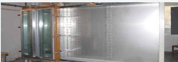
Pohľad na veľkú tlakovú komoru pre výskum filtrácie vzduchu detailmi alebo prvkami (okná, zasklené steny) obalových konštrukcií / The view of the big pressure chamber for research of air filtration through details or elements (windows, glass walls) of envelope constructions of buildings