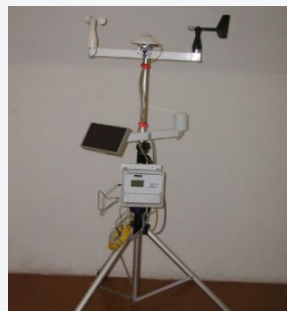
Meteorologická stanica AMS / AMS Meteorological station