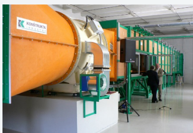
Aerodynamický tunel (pohľad zvonku) / Wind tunnel (the view from outside)