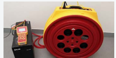
Pohľad na ventilátor s centrálnou jednotkou a diferenciálnym tlakomerom - súčasť zariadenia pre blower door test / The view of the fan with central unit and differential pressure gauge - a part of the device for the blower door test