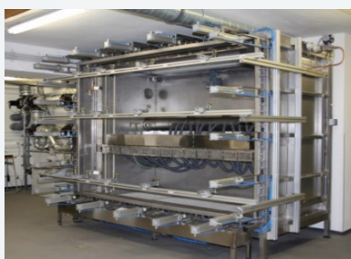
Dažďová komora pre výskum prieniku vody cez detaily stien a striech / Rain chamber for research of penetration of water through details of walls and roofs