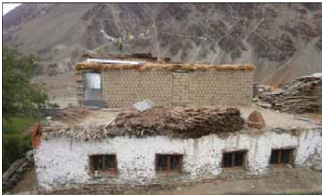
Typický himalájsky domček z nepálenej hliny s fotovoltaickým článkom a sušeným jačím trusom.

Po ďalších dňoch putovania sa ocitneme v dedinke Yal. Tu náhodou stretneme prívetivého inštalatéra solárnych panelov. Prezradil nám, že indická vláda sa rozhodla pomôcť ľuďom žijúcim v týchto nehostinných podmienkach aspoň tak, že každý obývaný domček má právo dostať jeden solárny panel. Tento panel dokáže počas dňa premieňať svetlo na elektrickú energiu a akumulovať ju v batérii. Domáci si takto môžu večer na pár hodín zasvietiť jednu žiarovku.