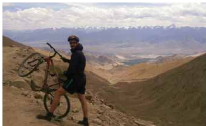
Zjazd z Kardung La, v pozadí Stok Kangri.

Varanasi je mystické mesto. Svedčí o tom aj fakt, že v minulosti mala väčšina zámožných ľudí z Indie práve tu postavené svoje letné sídla, paláce. Tí najzámožnejší mali palác postavený na brehu posvätej rieky Gangy, v tzv. ghátoch. Odtiaľto mohli každé ráno nerušene vykonávať hinduistické ceremónie – kúpať sa v „Matke Gange“.