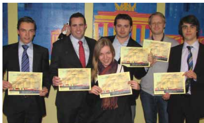
Víťaz IREC 2012 – London team.

„Na IREC 2012 som sa prihlásil, aby som vyskúšal niečo nové, úplne odlišné od predmetu môjho štúdia. A teraz musím konštatovať, že celá táto akcia ma príjemne prekvapila. Viac, ako som pôvodne očakával. Za jej prínosy považujem najmä pochopenie problematiky fungovania realitného trhu a spôsobu interakcie medzi aktérmi, keďže všetko sa odohrávalo vo vzťahu klient – konzultant/firma a nie, ako som zo školy