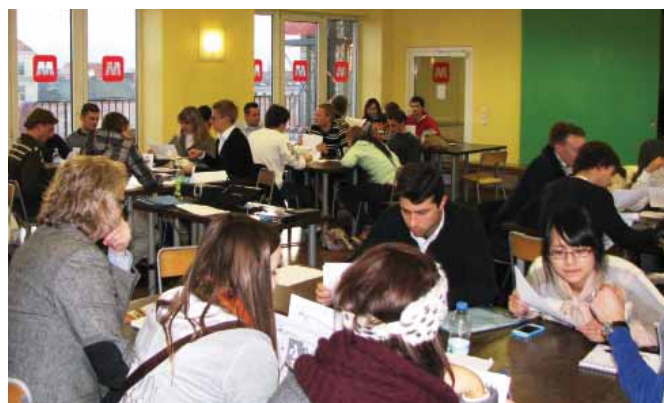
Práca v medzinárodných tímoch.