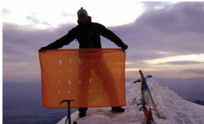
Vrchol Stok Kangri 6 135 m n. m.

rozhodneme vyťažiť čo najviac. Posledné dni si spestríme raftingom na rieke Zanskar, zjazdom bicyklami z najvyššie motoristicky prístupného sedla na svete – Kardung La (5 600 m n. m.) a štvordňovým výstupom na najvyšší vrch v blízkom okolí – Stok Kangri (6 135 m n. m.).