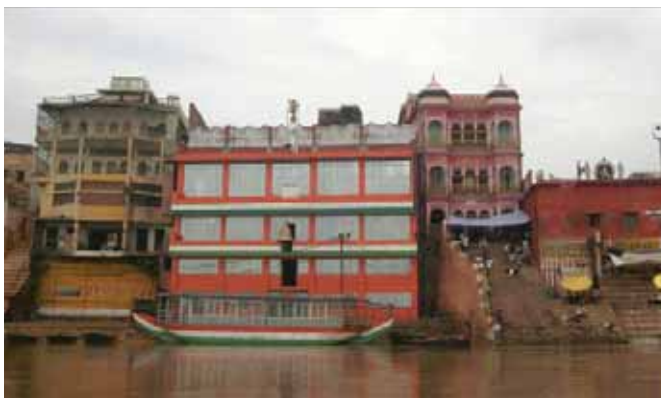
Moderná architektúra v kontraste s pôvodnou, pohľad z Gangy.

Zostáva nám ešte posledných 10 dní pobytu v Indii, z ktorých sa