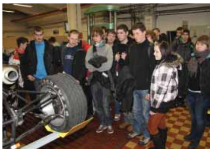
Konštrukcia a výroba študentskej formuly pútala veľkú pozornosť.

boli na záver sčítané a do finále súťaže boli pozvaní päťdesiat najúspešnejší študenti – 10 študentov v každej súťažnej kategórii.