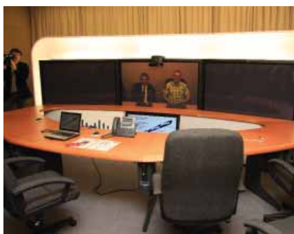
Komunikačné centrum na Rektoráte STU.

Systém TelePresence majú v prevádzke a je ho možné využívať na pedagogické i výskumné aktivity: Slovenská technická univerzita – rektorát, Slovenská technická univerzita – Materiálovotechnologická fakulta v Trnave, Univerzita Komenského – rektorát, Univerzita sv. Cyrila a Metoda v Trnave, Slovenská poľnohospodárska univerzita