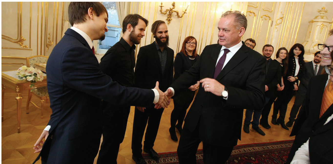
Laureáti ceny MOST 2016 – autori projektu Čierne diery u prezidenta SR.