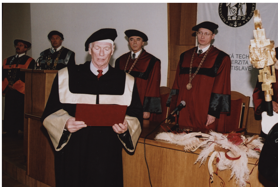
Slovenská technická univerzita v roku 2004 udelila E. A. Cernanovi čestný titul doctor honoris causa .

Vo veku 82 rokov zomrel 16. 1. 2017 astronaut česko-slovenského pôvodu Eugene Andrew Cernan.