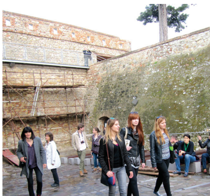
Návšteva Nitrianskeho hradu.

postúpili zaslúžení víťazi, potvrdili výsledky medzinárodného kola, kde sa študenti FA STU umiestnili nasledovne: