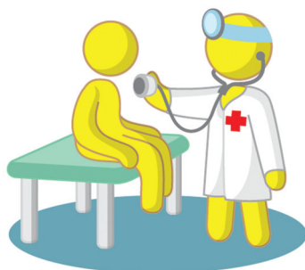
Ikonka pre lekára.

používajú vlastné kreslené „kartičky“ s obrázkami denného harmonogramu, predmetov či správania. Aplikácia dostupná cez internet by bola pre takéto zariadenia veľkou pomôckou. Študentky FA STU by rady systém videli ako otvorenú platformu – obrázky, ktoré slúžia na ikonografickú komunikáciu s deťmi, by bolo možné do systému dopĺňať a rozširovať databázu. Tá má teraz niekoľko častí – ikony pre jedenie, zábavu, kultúru a relax, hygienu, oblečenie, vzdelávanie, šport, spánok a pre komunikáciu (rôzne oznámenia či usmernenia).