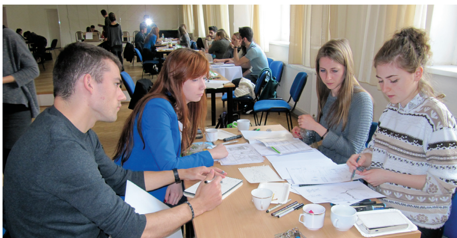
Atmosféra medzinárodného workshopu.

Súťaž je tradične vypísaná pre školy architektúry v rámci združenia. Prebiehala od novembra do 5. mája, keď sa postupne uskutočnili národné a následne medzinárodné kolá. Zaujímavosťou bolo, že medzinárodné kolo prebiehalo na mieste vypísanej témy, v Modre. Do tejto úrovne súťaže bolo odovzdaných 16 návrhov z 11 škôl architektúry z piatich krajín. V medzinárodnej porote mala každá škola jeden hlas s podmienkou, že nemohla hlasovať za svoj návrh. Vzhľadom na rovnosť bodov boli udelené dve prvé a dve tretie miesta, druhé miesto nebolo udelené. To, že z národného kola